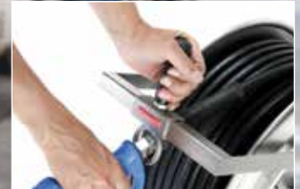
Schlauchführung für sauberes Auf- und Abspulen