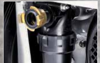
Wartungsfreundlich - leicht zu reinigender Wasserfilter