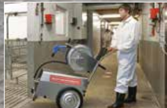
Langer Griff in ergonomischer Arbeitshöhe für jede Größe