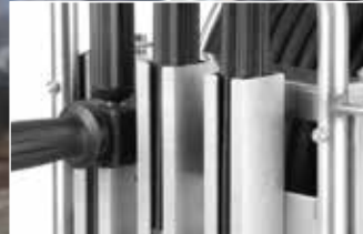
komfortable und sichere Halterung für die Lanzen