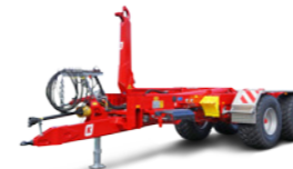
THL 20 (20 - 24 to Gesamtgewicht, 17-21 to Aufzugskraft)