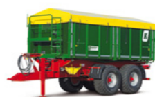
TKD 302 (20-24 to Gesamtgewicht)