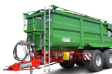
MUK 303 (20-24 to Gesamtgewicht)