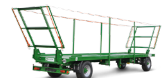
PWO 18 (18 to Gesamtgewicht)