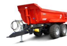
MUP 20 HP (20 - 24 to Gesamtgewicht)