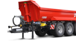
MUP 30 HP (31 - 34 to Gesamtgewicht)