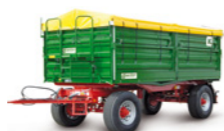
HKD 290 (18 to Gesamtgewicht)