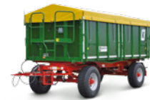
HKD 302 (18 to Gesamtgewicht)