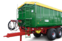
TKD 302-S (20-24 to Gesamtgewicht)