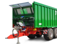
TAW 20-K (20 - 24 to Gesamtgewicht)