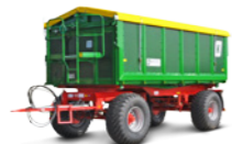
HKD 302-S (18 to Gesamtgewicht)