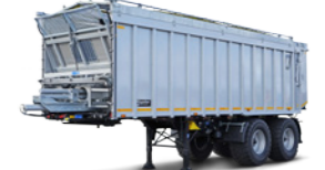
SAW 32 (32 to Gesamtgewicht)