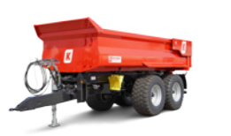
MUP 20 SP (22 - 24 to Gesamtgewicht)