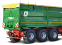
MUK 402 (31 - 34 to Gesamtgewicht)