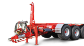
THL 30 (31 - 34 to Gesamtgewicht, 30 to Aufzugskraft)