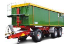
TMR 34 (34 to Gesamtgewicht)