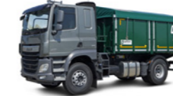
ZKA 1 (16 to Gesamtgewicht)