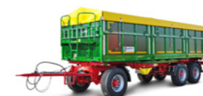
HKD 402 (24 to Gesamtgewicht)