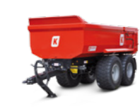
MUP 20 VG (22 - 24 to Gesamtgewicht)