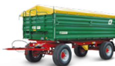
HKD 200 (14 to Gesamtgewicht)